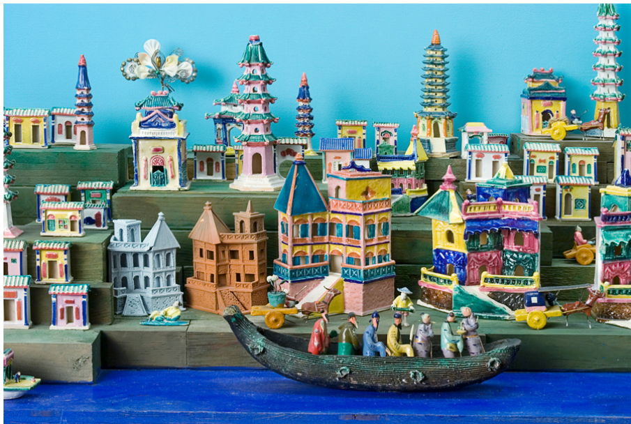
Chinese Village. Case # 19-15. Multiple Visions: A Common Bond . The Girard Wing. Museum of International Folk Art.

Todos somos parte de una comunidad: una familia, un vecindario, un pueblo, un estado, un país y del mundo. Los diferentes papeles que desempeñan las personas conforman nuestras comunidades, desde nuestra familia, amigos y vecinos hasta compañeros de clase, maestros(as), etc. Todos los lugares de una comunidad también son importantes, desde la casa de nuestra familia, parques, la oficina de correo, supermercados, bibliotecas, escuelas y hasta museos. Nuestras comunidades nos hacen sentir que pertenecemos a algo y tener una conexión entre nosotros. Piensa en tu comunidad, ¿qué lugares y cosas te gustaría que formen parte de tu pequeña comunidad?